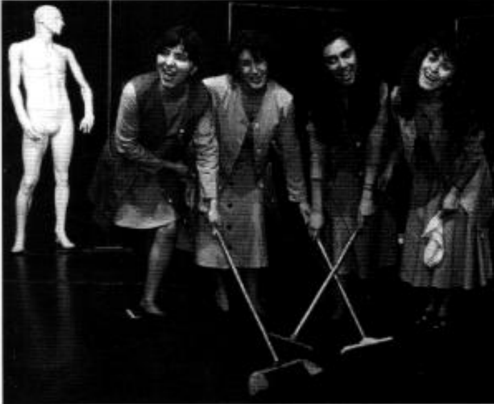
„Die Türkinnen kommen!“ Putzfrauen-Kabarett des Kölner Arkadaş-Theaters

Freitag, 12. November, 20.00 Uhr Kulturtreff, Helmstraße 1