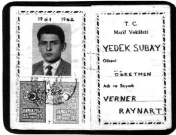
Dienstausweis als Lehrer beim Militär

Montag, 22. November, 20.00 Uhr Kulturtreff, Helmstraße 1