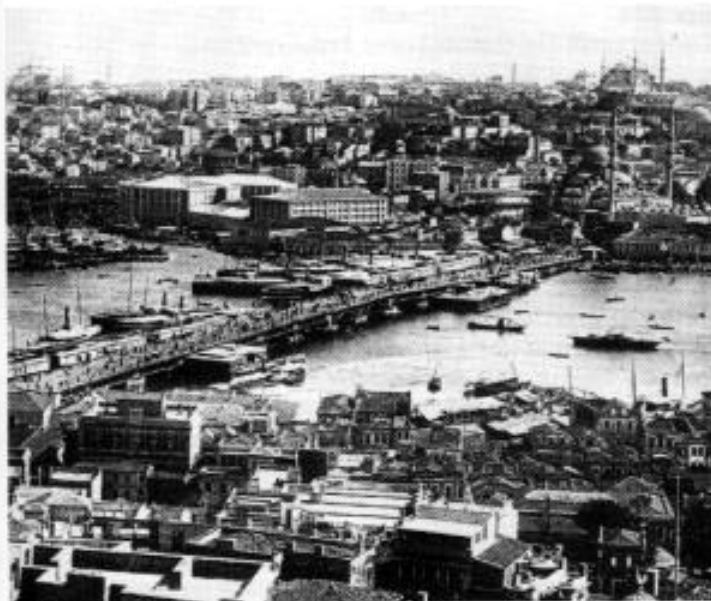
Alte Galata-Brücke (Historische Aufnahme)