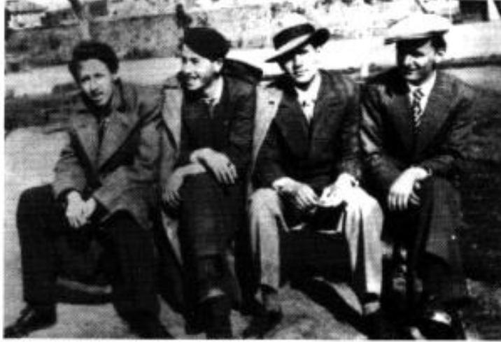
Oktay Rifat, Orhan Veli Kanık, Melih Cevdet Anday und Şinasi